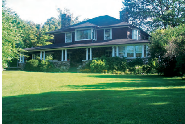
Ambiance cosmopolite au Normandie Beach Resort près du lac Champlain, Westport