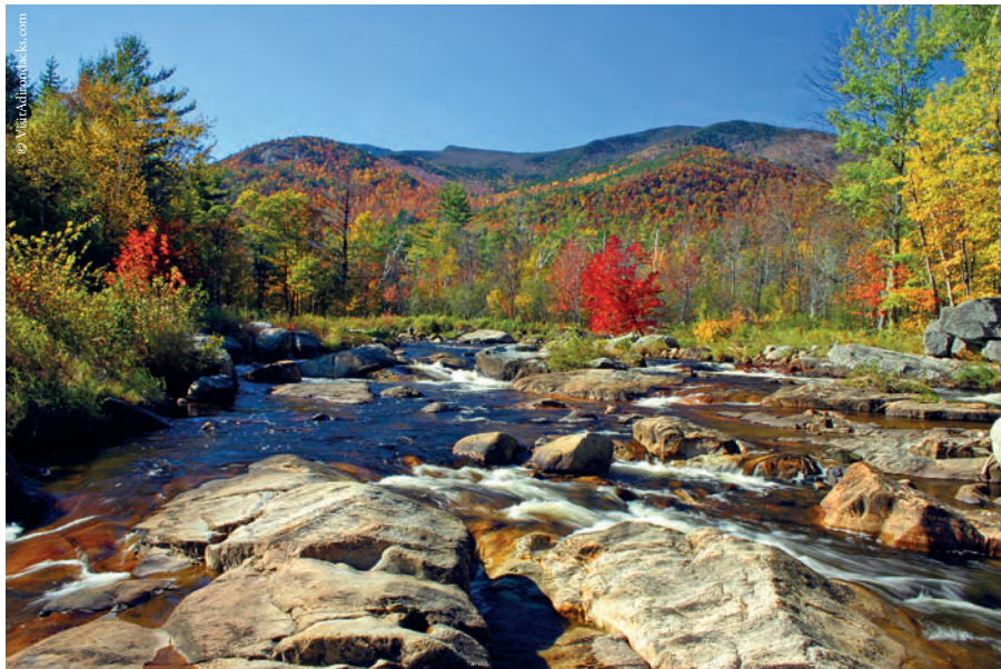
Ausable River, au pied de Whiteface Mountain dans les Adirondacks

L'Hudson recèle de belles demeures datant du 19 ème siècle érigées sur ses rives escarpées par des barons d'industrie, inventeurs et artistes. Locust Grove, cottage de Samuel Morse et son parc fleuri. L'élégante Saratoga Springs connue pour ses eaux curatives vibre tout l'été à l'heure des courses hippiques et des paris. Plus au nord, dans les Adirondacks, Crown Point, Fort Saint Frédéric et Fort Ticonderoga évoquent les rudes combats que se livrèrent Français, Anglais et Américains pour le contrôle des axes fluviaux, du lac