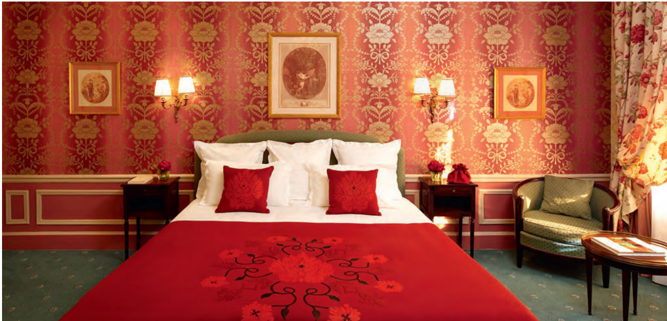
Hôtel Westminster, Paris

Plus de 50 hôtels, resorts & spas aux quatre coins du monde.