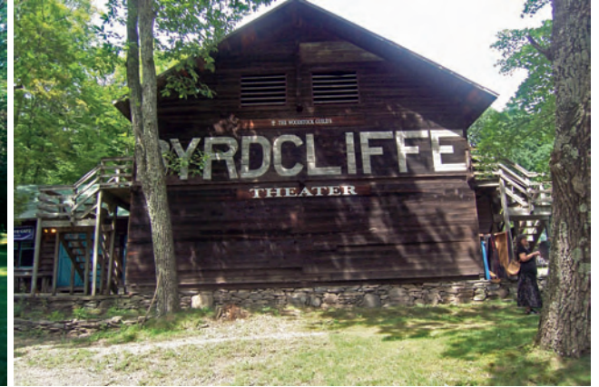
White Pines, Byrdcliffe Arts Colony, Woodstock

“State Parks” de New York. Sites et écosystèmes protégés et gérés par l'état, ce sont de véritables paradis, en toutes saisons, pour les sportifs et amoureux de la nature à l'état sauvage. Bear Mountain State Park où cervidés paissent en confiance ; au sommet une sublime vue sur la Skyline de Manhattan à 80 kms. Minnewaska State Park dans les montagnes Shawangunk aux perspectives spectaculaires. Et le massif montagneux des Adirondacks, depuis 1894 la plus grande réserve naturelle